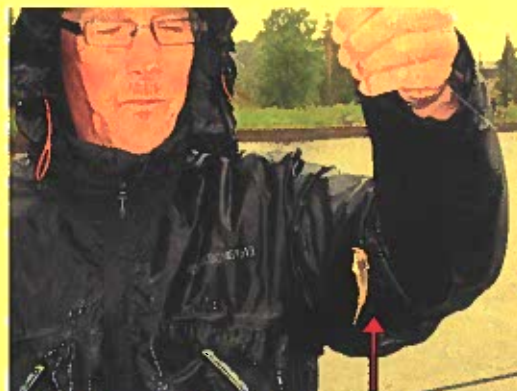
Blygsamma fångster för en del.