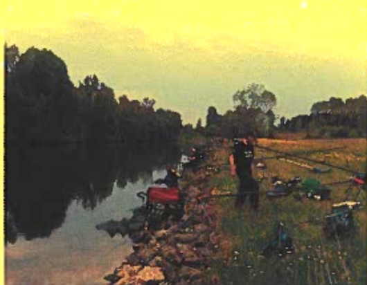
Fin tävlingsträcka på SM i Int. Mete