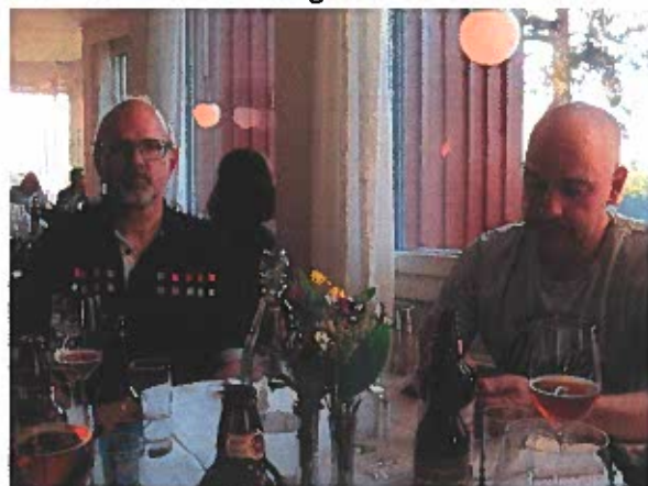
Efter lördagens tävling intogs en välbehövlig middag i restaurangen för att ladda batterierna.

Vi steg upp tidigt på söndagsmorgonen för att äta frukost, idag fick vi servera oss själv, allt var iordningställt men vi fick plocka fram allt själva. Vi tömde sen rummet och åkte mot Kinda kanal, redan nu blåste det kraftigt och samma riktning på vinden, längs med kanalen.