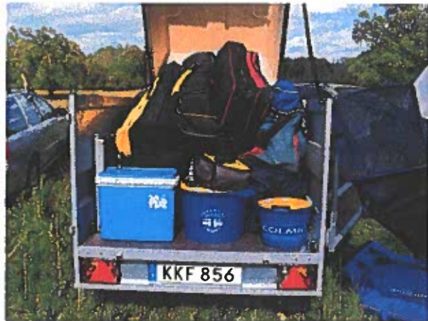
Inte fullt så kaosartat packat som det brukar se ut hos vår kollega

Vi steg upp tidigt på lördagsmorgonen för att äta frukost. Efter det åkte vi iväg, tävlingssträckan ligger verkligen ute på bondvischan, vi fick passera ett antal bondgårdar, åka över några åkrar för att slutligen parkera i en kohage (utan kor för dagen). Väl på plats började vi packa ur prylarna, vagnen lastades och kördes ned till sträckan.