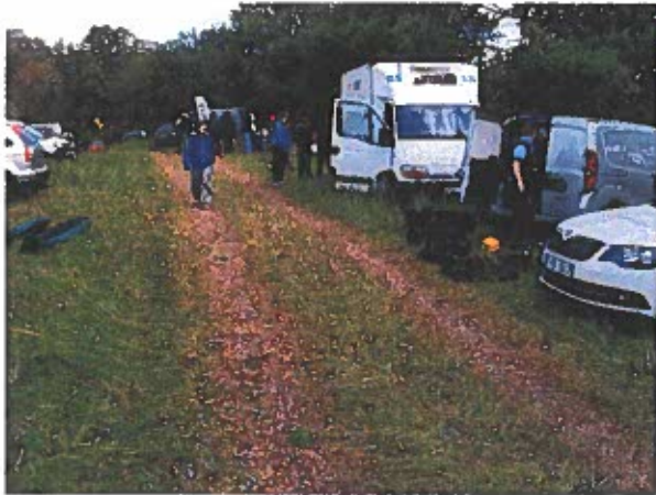
Parkeringen var väl lite si och så.

Vi åkte ner redan på fredagskvällen för att slippa gå upp så tidigt. Väl på plats så fixade vi till rummet, några av oss blandade mäsk. Sen åkte vi till rimforsa och fick något i magen.