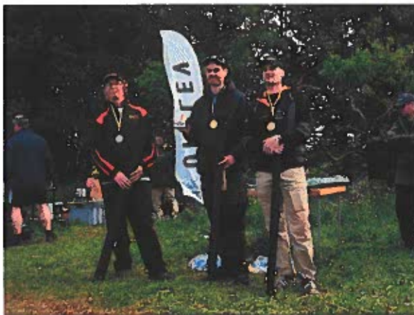
Johan SM vinnare i mormyska 2015, nu vinnare i Int.mete samma år.

Jag tycker det var ett bra arrangemang, någon liten fadäs på lördagsmorgonen annars flöt allt på bra. Ett litet minus var väl korven, Bullens varmkorv tyckte inte jag var speciellt god, ätbar men inte mer.