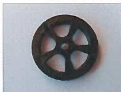
Svarta VM spö rullar 5:-/st