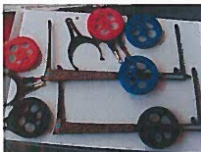
Vim pirkens Taffsiske spön, 2st, 3 Rullar, 2 toppar, 250:-/st Nypris 499:-/st