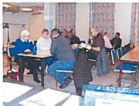
några deltagare på Klubbens årsmöte 2019