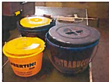
Mäskhinkar 12, 17 och 25liters