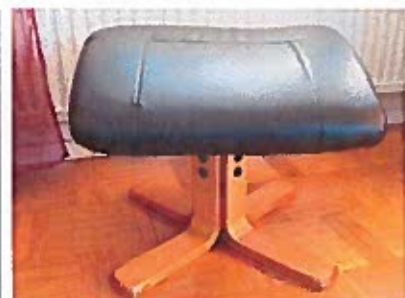
Fotpall till fätöljen, exakt som den på bilden fast sprillans ny ouppackad och omonterad 250:-