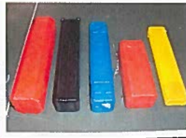
Flötes/pimpelspö förvaring Bortskänkes mot avhämtning