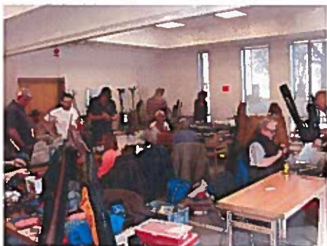
Fiskeloppis i Västerås April 2019