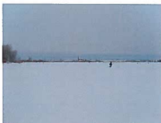
Man skulle varit närmare bebyggelsen!

Det var Bara Magnus Eriksson från Fagersta AFK som fick pris av alla västmanlänningar, ett av våra sämre SM med Västmanländska ögon sett, Både jag och Antero fiskade väl hyfsat utan att glänsa 5,1 respektive 4,5kg.