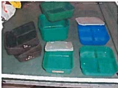
Betes burkar 15, 20, 25:-/St