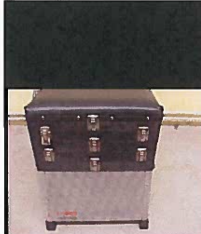
Tackelstol, perfekt för trad. Mete 400:-